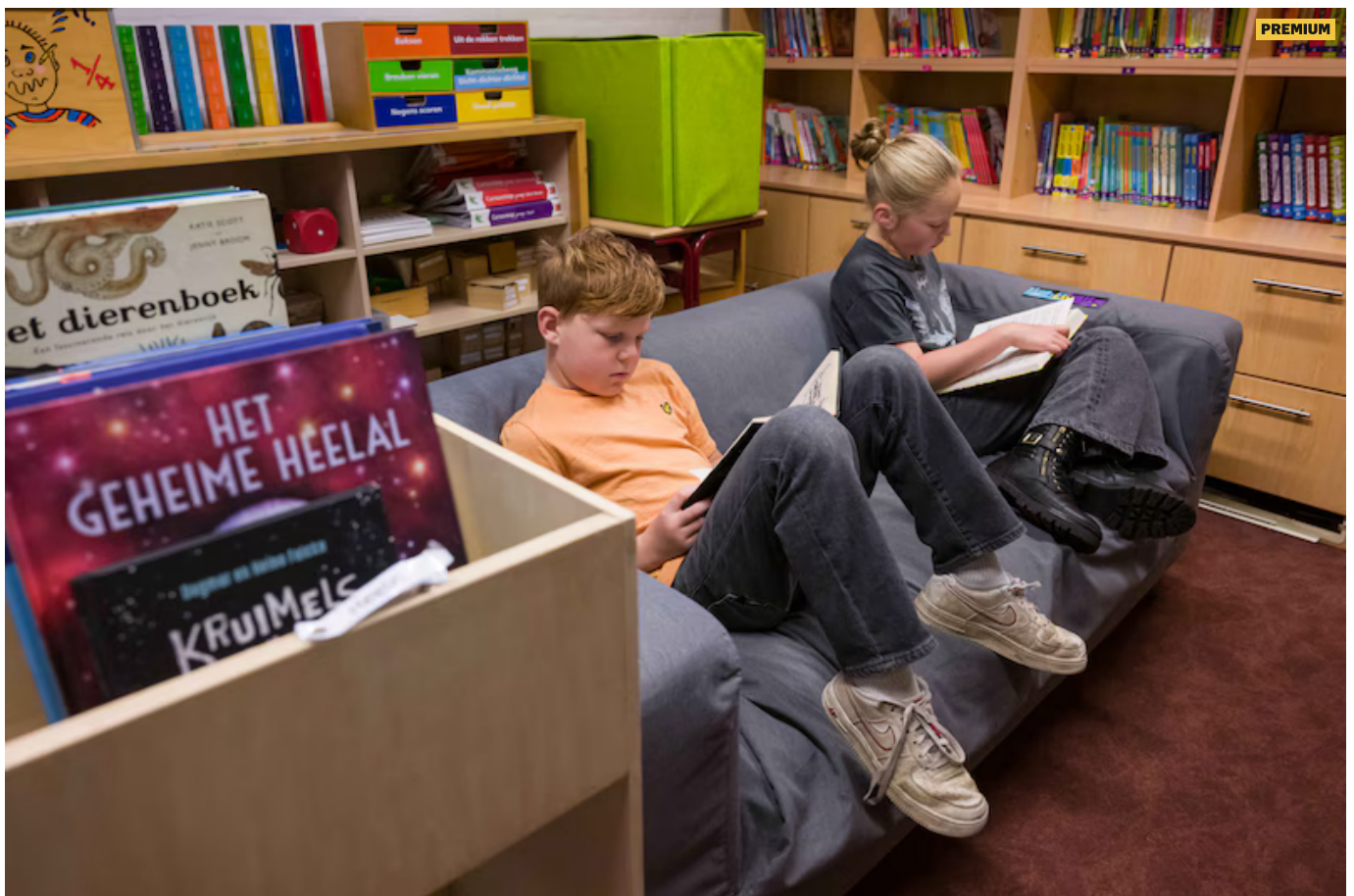
▲ Waarom in het lokaal lezen? Op basisschool Sint Jozef in Rietmolen is ook voor de grote boekenkast genoeg plek.