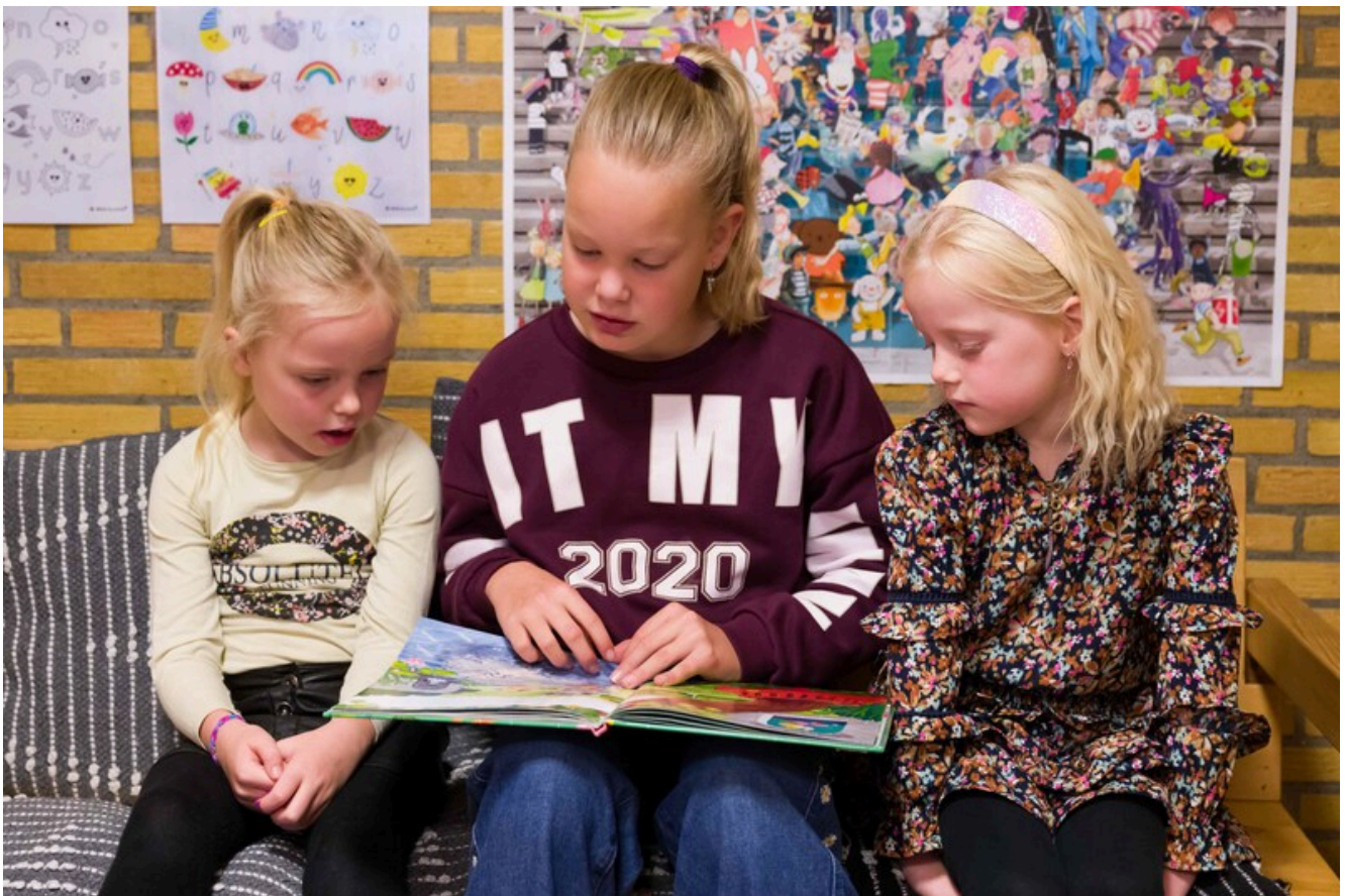
▲ Ook groep 1 en 2 zijn helemaal in de ban van boeken.