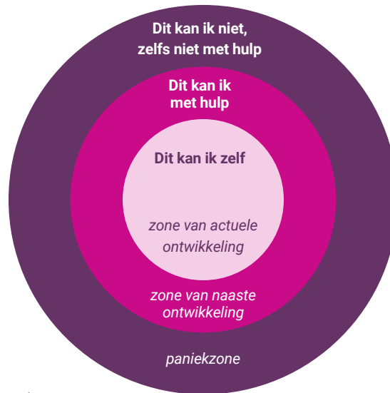
Figuur 3 Zones van ontwikkeling (Vygotsky, 1994)

Het is belangrijk om studenten te leren gerichte feedback vragen te stellen, zodat de antwoorden de student helpen om in de zone van naaste ontwikkeling of actuele ontwikkeling te komen (figuur 3). Op deze manier draagt de feedback bij aan de persoonlijke professionele ontwikkeling. In paniek raken helpt niet om tot ontwikkeling te komen. Is dit wel het geval, vraag dan aan de student waar het paniekgevoel vandaan komt en wat deze kan doen of nodig heeft om uit de paniekzone te komen.