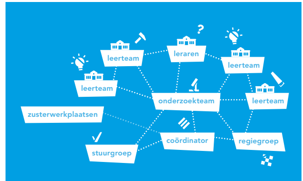
Netwerk Werkplaats Onderwijsonderzoek Amsterdam

In de Werkplaats is de bestaande praktijkkennis uitgangspunt voor reflectie en onderzoek. Het startpunt zijn de onderzoeksthema's en vragen die door de verschillende leerteams vanuit de scholen aangedragen worden. Studenten vanuit de kennisinstellingen draaien mee bij het onderzoek binnen de Werkplaats. De onderzoeksvragen uit de diverse leerteams leiden tot interventies in en om de klas, waarbij we gebruik maken van verschillende onderzoeksmethoden: casestudies, ontwerponderzoek en op elkaar voortbouwende kleinschalige experimenten.