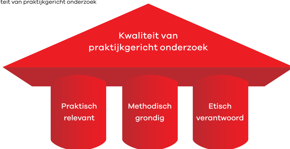
Figuur 1 Kwaliteit van praktijkgericht onderzoek

Daarna is gekeken op welk element van het onderzoeksproces een criterium betrekking heeft, zoals de onderzoeksvraag, het onderzoeksontwerp of de resultaten van het onderzoek. Dit leverde 9 elementen op (zie figuur 2):