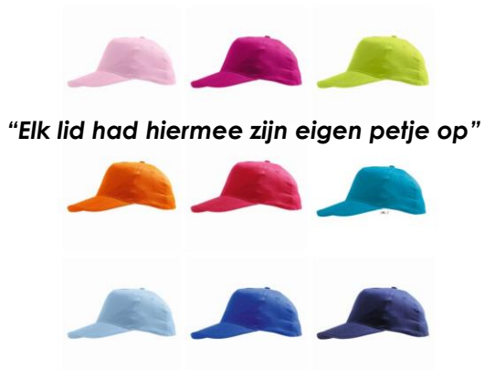
"Elk lid had hiermee zijn eigen petje op"

UPDATE KENNISLAB BLENDED LEARNING (IN HET VO) In deze korte heads-up geven we je een update over de vorderingen van het Kennislab Blended Learning.